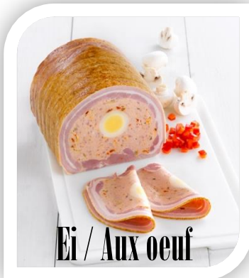
Ei / Aux oeuf