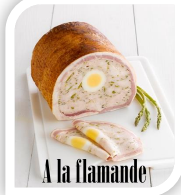
A la flamande