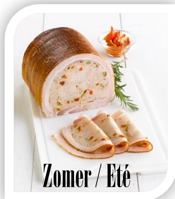
Zomer / Eté