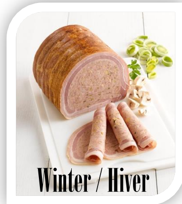
Winter / Hiver