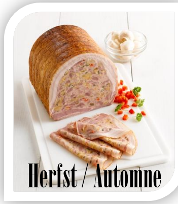
Herfst / Automne